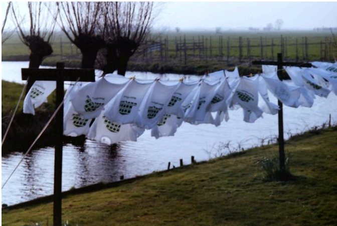
Een stukje geschiedenis.

De buitenplaats Noordhove was gelegen tussen de Noordendijk, Groenedijk en de huidige Oranjelaan.